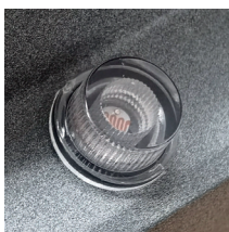
Con Foto Sensor